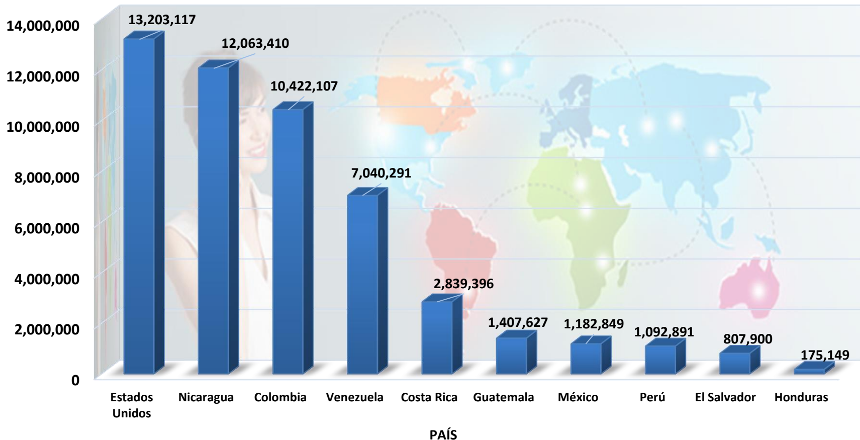
Gráfico 3. MINUTOS SALIENTES DE LARGA DISTANCIA INTERNACIONAL DE LOS 10 PAÍSES CON MAYOR TRÁFICO. AÑO 2023